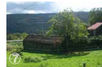
Paredes do Rio Complexo Hidráulico Irrigation system complex