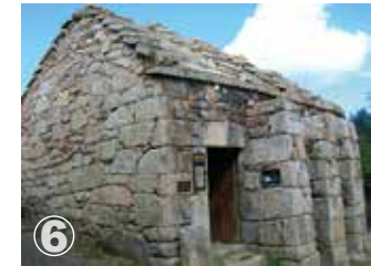
Tourém Forno Comunitário Comunitary Oven