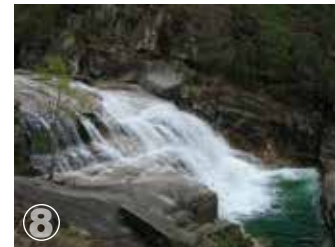
Ermida Cascatas do Thaiti Tahiti waterfalls

Escala aproximada Approximate scale 1:200.000