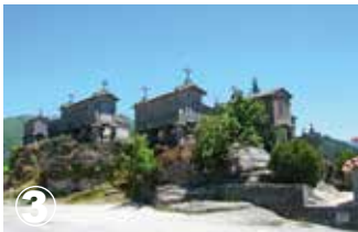
Soajo Espigueiros (Canastos) Raccards