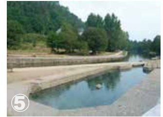
Baño Águas quentes Hot Springs