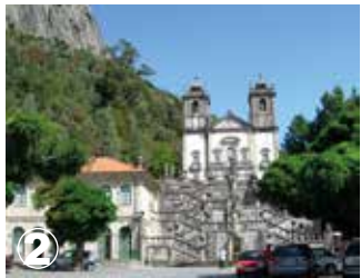
Peneda Santuário da Nª Srª da Peneda Our lady of Peneda Sanctuary