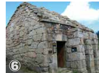
Tourém Forno Comunitário Four communautaire