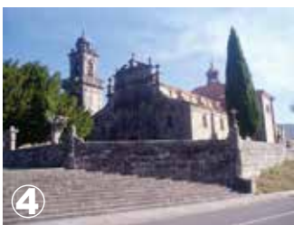
Entrimo Igreja de Santa María la Real Église de Santa Marie la Real