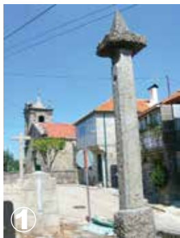
Castro Laboreiro Pelourinho e Igreja Pilori et église