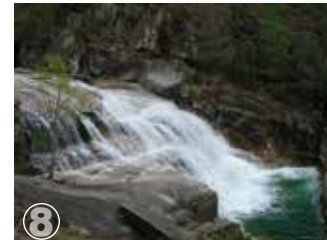
Ermida Cascatas do Thaiti Cascades du Thaiti

Escala aproximada Échelle approximative 1:200.000