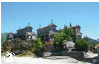
Soajo Espigueiros (Canastos) Dépôt de maïs