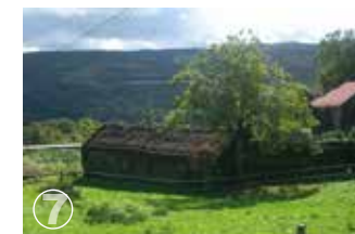
Paredes do Rio Complexo Hidráulico Complexe hydraulique