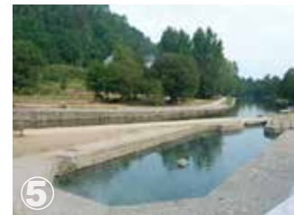
Baño Águas quentes Eaux chaudes