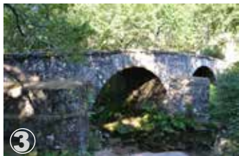
"Ponte dos Eixões"