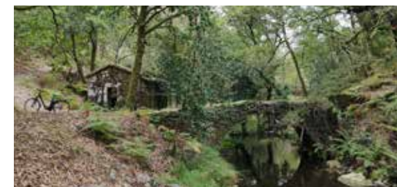
Ribeiro de Rodes

Follow the roman road and some narrow rural trails that will lead you back to the main road and then back to Parque Cerdeira.