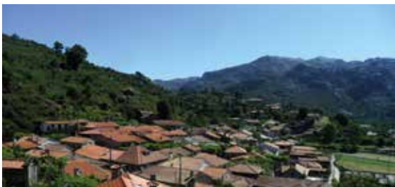
Campo do Gerês

Percorrido o trajeto da Via Romana e dos caminhos rurais, volta e entrar na Estrada Nacional de regresso ao Parque Cerdeira.