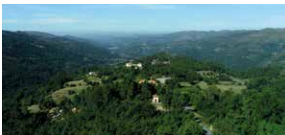
Bom Jesus das Mós