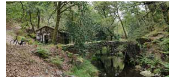
Ribeiro de Rodes

Follow the roman road and some narrow rural trails that will lead you back to the main road and then back to Parque Cerdeira.